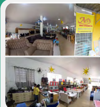
ART'S MÓVEIS Iporanga