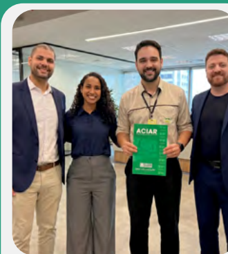
NATIVA Soluções Ambientais

Nossa força tem nome e CNPJ: são os nossos associados. É por eles que a nossa voz pesa, que a cidade respeita e que as coisas acontecem.