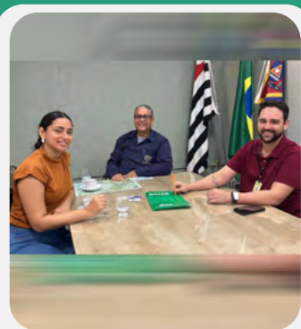
INFYNITUN Gestão Imobiliária