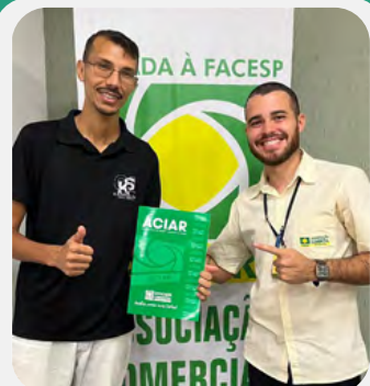
KARRIELO1 Social Media