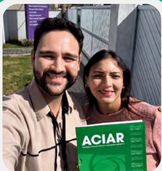
CLÍNICA PEQUENO MUNDO